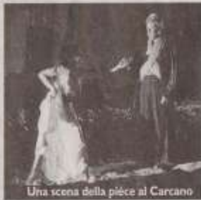
Una scena della pièce al Carcano